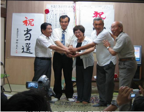
選挙事務所で当選を喜ぶ

後初の七月二十四日に行われた合併 得て、川口市議会議員選挙にお できました。一七位で当選すること し皆様方の絶大なご支援に対 し心より感謝いたします。 員がこの選挙では三十四人の新議 た。5人の新人議員が誕生しまし